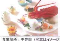
食事場所：千寿閣 (写真はイメージ)

誕生 春会席の夕食プラン お一人様 10,000円(税込) (オプションの特別拝観付き)