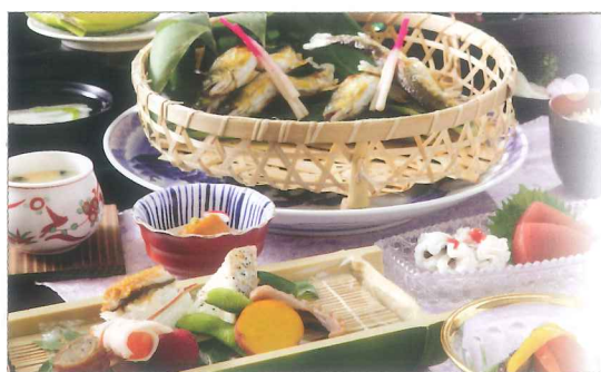
写真は涼風三昧イメージです

場所 昼の溪涼床 時間 午前 11:30 ≫ 午後 3:00 (11:30~13:00/13:30~15:00の2部制にて承り) ラストオーダー午後1:30