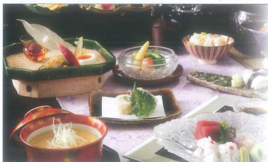
写真は会席料理イメージです

・雨天時には室内のご用意になる場合がございます。 ・涼風づくし7,500円コースに限り、仕入の都合上2日前の15時までにご予約をお願いいたします。