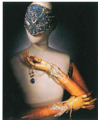
Florence Müller, Costume Jewelry for Haute Couture, Patrick Sigal ed., London, Thames & Hudson, 2006

本展は、コスチュームジュエリーにスポットをあてた世界的にもまれな展覧会です。研究家でコレクターでもある小瀧千佐子氏の貴重なコレクションより選りすぐった約450点の作品を通して、自由にデザインされたコスチュームジュエリーの世界をご紹介します。