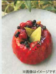
※画像はイメージです。