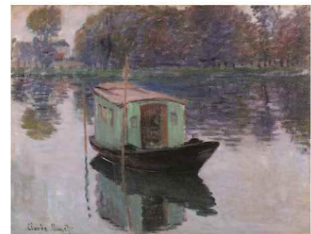
モネのアトリエ舟 1874年 クレラー=ミュラー美術館