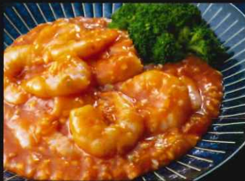
【海老のチリソース仕立て】