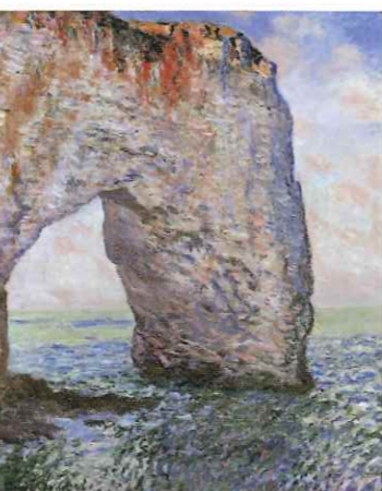
エトルタのラ・マンヌポルト 初来日 1886年 メトロポリタン美術館 Bequest of Lillie P. Bliss, 1931 ($1,67.11)