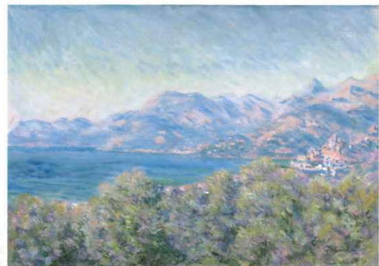
ヴェンティミリアの眺め 1884年 グラスゴー・ライフ・ミュージアム(グラスゴー市議会委託) © CSG CIC Glasgow Museums Collection. Presented by the Trustees of the Hamilton Bequest, 1943

モネは何度も同じ場所を訪れ、対象が季節や天候、時刻によって絶え間なく変化する様子を描き留めた