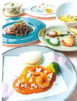
旬味を愉しむ春爛漫コース ～春の彩りを一皿一皿に添えて～