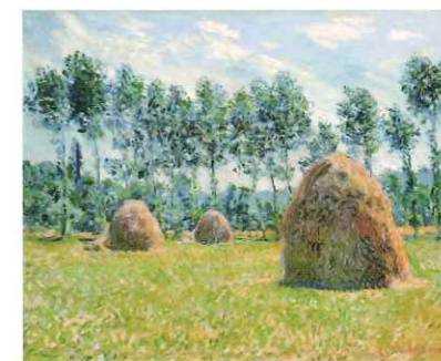
ジヴェルニーの積みわら 1884年 ボーラ美術館