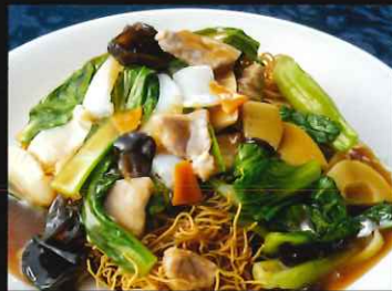
【具沢山の五目餡かけ揚げそば】