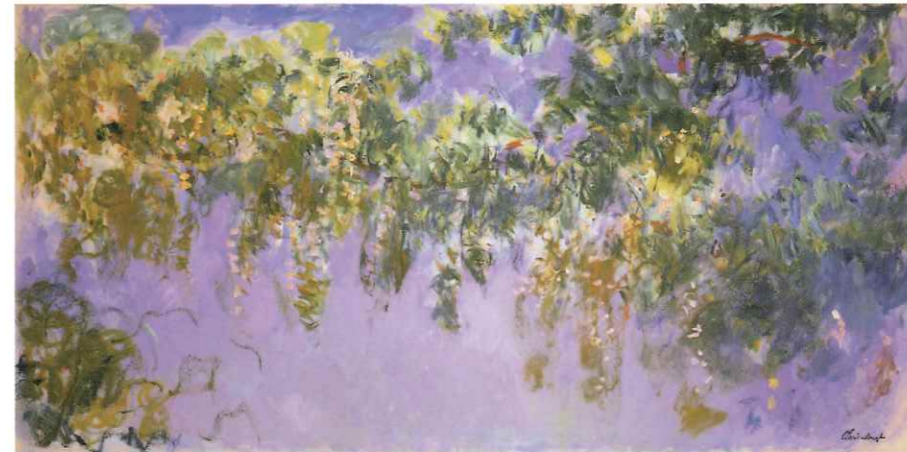
藤の習作 大阪展限定 1919-20年 ドゥルー美術館歴史博物館 Musée d'Art et d'histoire de Dreux

後半生のモネがジヴェルニーで描いた村の様子や、モネが愛した庭のさまざまな情景を紹介