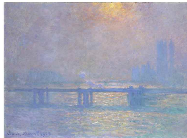
チャリング・クロス橋、テムズ川 1903年 リヨン美術館 B 1725

1880年代中頃から描き始めて「連作」へと結実した「積みわら」のほか、様々なテーマで描いた「連作」を展示