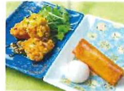
【鶏の唐揚げ きつぱりレモン風味の唐揚げソース】 & 【本日の飲み茶と五目春巻きの盛り合わせ】

追加オプション料理 (2品付き) お一人様 1,200円(税込1,320) ※1品追加の場合は700円(税込770)となります。