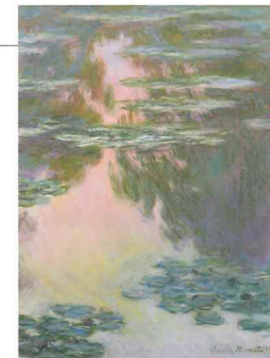
睡蓮の池 大阪展限定 1907年 石橋財団アーティゾン美術館