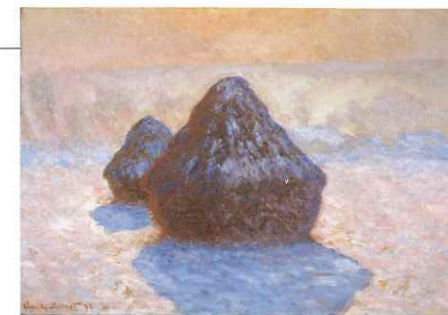
積みわら、雪の効果 1891年 スコットランド・ナショナル・ギャラリー © National Galleries of Scotland. Bequest of Sir Alexander Maitland 1965