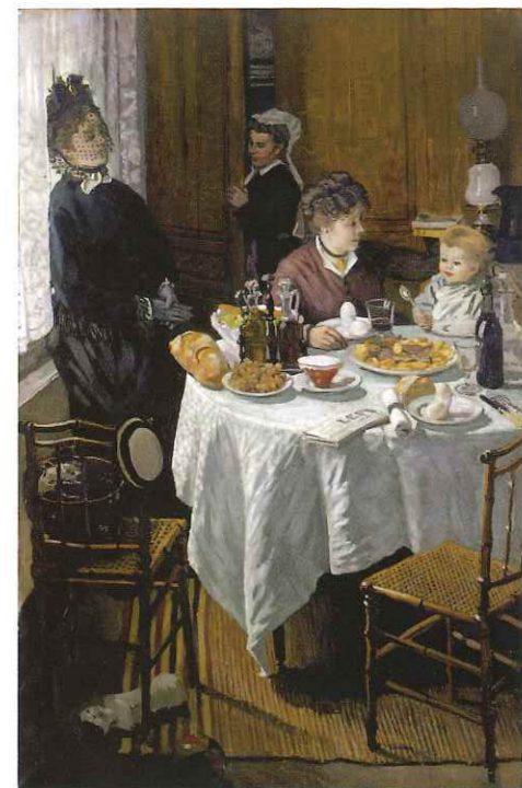
昼食 初来日 1868-69年 シュテッデル美術館