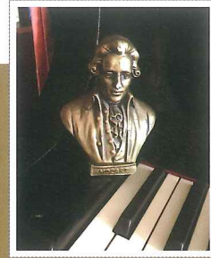
幼少期からピアノの横にある母親からの贈り物 (鼻の欠けたモーツァルト像)

サラのモーツァルトの音楽との出会いは 3 歳。月曜から金曜までの毎日 4 時半にラジオから流れる「フィガロの結婚」の序曲から始まる音楽番組を、毎日逃さず取り憑かれたように熱心に聴いていたそうです。それを見た母親が先生につけたのがピアノとの出会いです。サラにとってモーツァルトは音楽家としての中核。今でも最も重要なレパートリーとなっています。モーツァルトの大家であるパウロ・バドゥラ＝スコダ氏との親交も深く共に意見を交わす仲です。モーツァルトへの深い尊敬と愛を込めて、これまでにない切り口のプログラムでお贈りする 4 日間の公演にご期待ください！